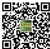
编辑部微信公众号