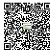
天津中医药大学学报APP