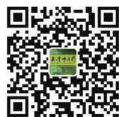
编辑部微信公众号