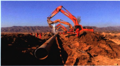
山西神木—安平项目D813 mm/50 km

四川石达能源发展有限公司是一家专业从事从气田地面到天然气长输管道至城镇燃气终端的全产业链的设计工程公司。业务覆盖全过程咨询、投融资、规划、勘察设计、EPC总承包。管理团队拥有20年以上的石油天然气从业经验。技术总监及主要骨干主持或参与了国家骨干管网设计和建设工作。