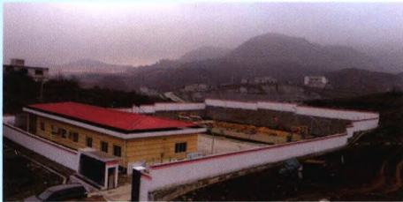
贵州遵义—赫章项目D457 mm/310 km