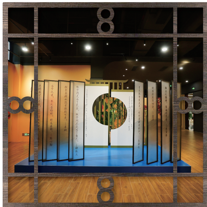
广东省立中山图书馆主题馆