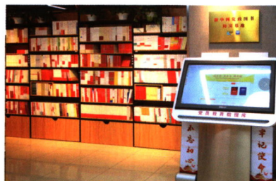
新华网党政图书记读基地