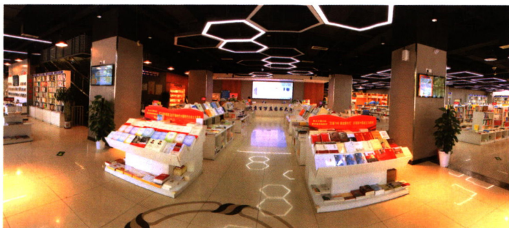
重点主题出版物展示