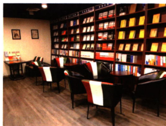
百万庄文化创客空间

地址：北京市西城区百万庄大街22号 邮编：100037 bwz-bookbuilding（百图官网） 电话：010-88379246/9161（馆配、教材） 010-88379645/9646（店面零售）