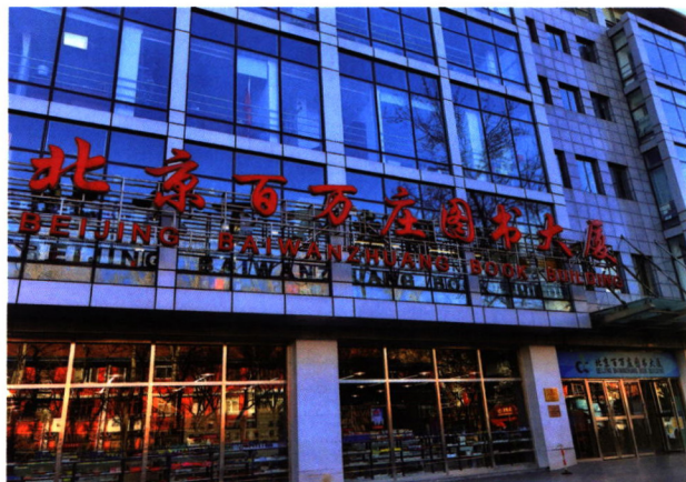
北京百万庄图书大厦

2006年9月26日，北京百万庄图书大厦有限公司（简称百图公司）卖场位于京西百万庄大街22号盛大开业。百图公司是由机械工业出版社全资投资成立的大型国有图书销售企业，作为机工社的图书分销产业，我们面向全国高等院校图书馆、公共图书馆、企事业单位、科研院所、社会团体、个人读者等开展专业化多元化高价值的服务。我们是由单体出版社投资的综合体图书大厦，也是全国的社办书店。百图公司以“放飞知识、服务读者”为己任，本着“服务社会、服务需求、服务读者”的宗旨，依托机械工业出版社在科技信息研究、图书出版领域的雄厚实力和行业优势，坚持“店销直销互补、多业态经营”的发展战略，重点构建协同发展、复合经营的差异化销售模式，致力于打造国内的图书零售及特色信息服务商。