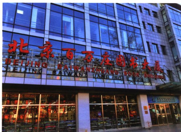
北京百万庄图书大厦

2006年9月26日，北京百万庄图书大厦有限公司（简称百图公司）卖场位于京西百万庄大街22号盛大开业。百图公司是由机械工业出版社全资投资成立的大型国有图书销售企业，作为机工社的图书分销产业，我们面向全国高等院校图书馆、公共图书馆、企事业单位、科研院所、社会团体、个人读者等开展专业化多元化高价值的服务。我们是由单体出版社投资的综合体图书大厦，也是全国的社办书店。百图公司以“放飞知识、服务读者”为己任，本着“服务社会、服务需求、服务读者”的宗旨，依托机械工业出版社在科技信息研究、图书出版领域的雄厚实力和行业优势，坚持“店销直销互补、多业态经营”的发展战略，重点构建协同发展、复合经营的差异化销售模式，致力于打造国内的图书零售及特色信息服务商。