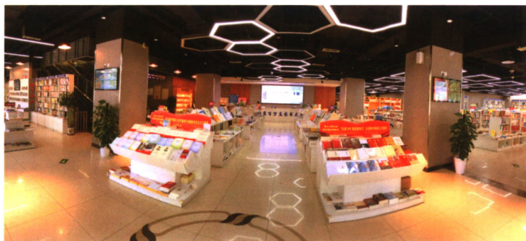
重点主题出版物展示