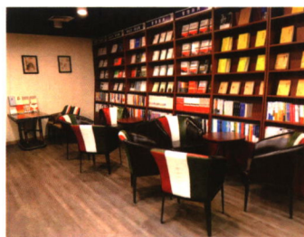
百万庄文化创客空间

地址：北京市西城区百万庄大街22号 邮编：100037 bwz-bookbuilding（百图官网） 电话：010-88379246/9161（馆配、教材） 010-88379645/9646（店面零售）