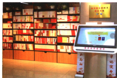
新华网党政图书阅读基地