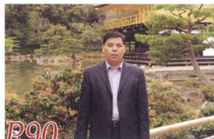
核电主泵轴封的性能介绍及常见问题分析