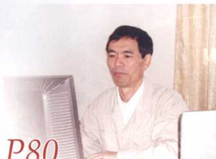
煤气化工艺中的特殊控制阀