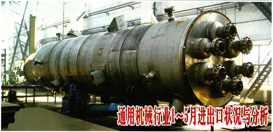
通用机械行业1~5月进出口状况与分析