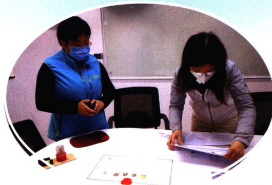
▲ 进出口银行广东省分行客户经理赴某核酸检测企业提供金融服务