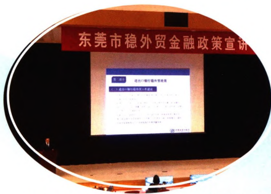
▲ 2020年4月，进出口银行广东省分行参加东莞市稳外贸政策性金融宣讲会