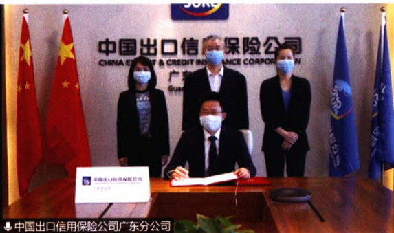
中国出口信用保险公司广东分公司