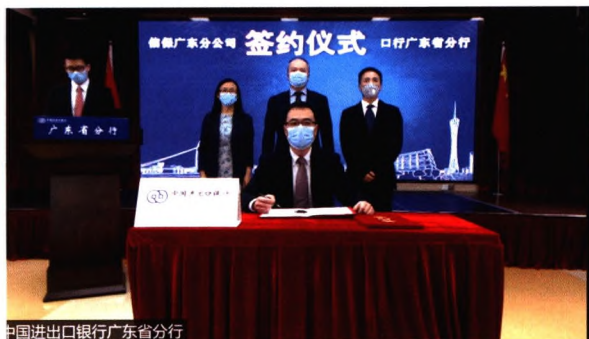
中国进出口银行广东省分行

2020年上半年，进出口银行广东省分行充分发挥政策性金融作用和逆周期调节作用，全力服务“六稳”“六保”工作，为广东疫情防控和实体经济发展贡献力量。截至6月末，该行本年累计发放贷款538亿元，贷款余额1378亿元，较年初增加250亿元；发放贷款和新增贷款均创分行成立11年来同期新高。