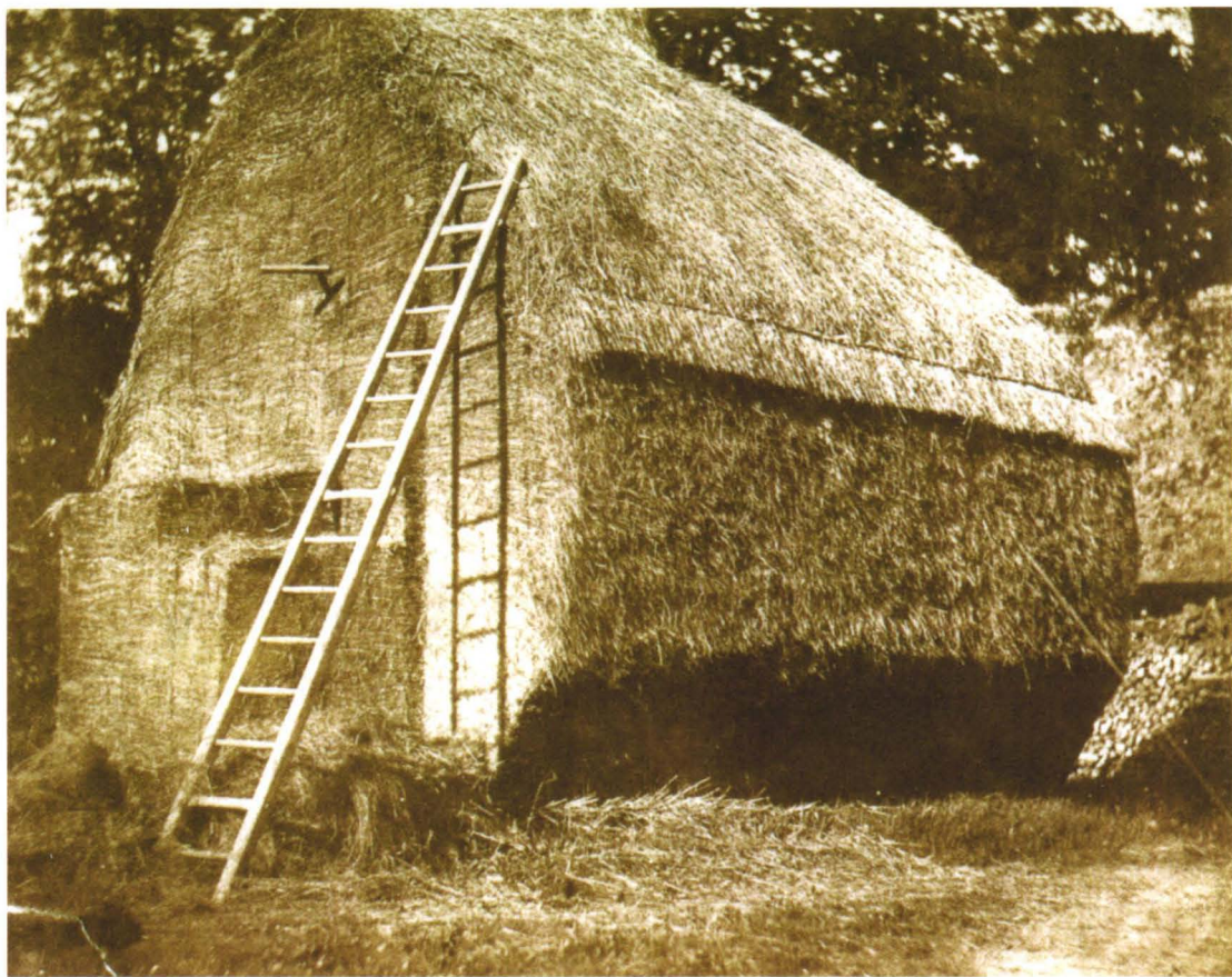
威廉·亨利·福克斯·塔尔博特 ·干草垛，约 1842

（选自《照片秀：定义摄影史的重要展览》 中国民族摄影艺术出版社 2015 年版）