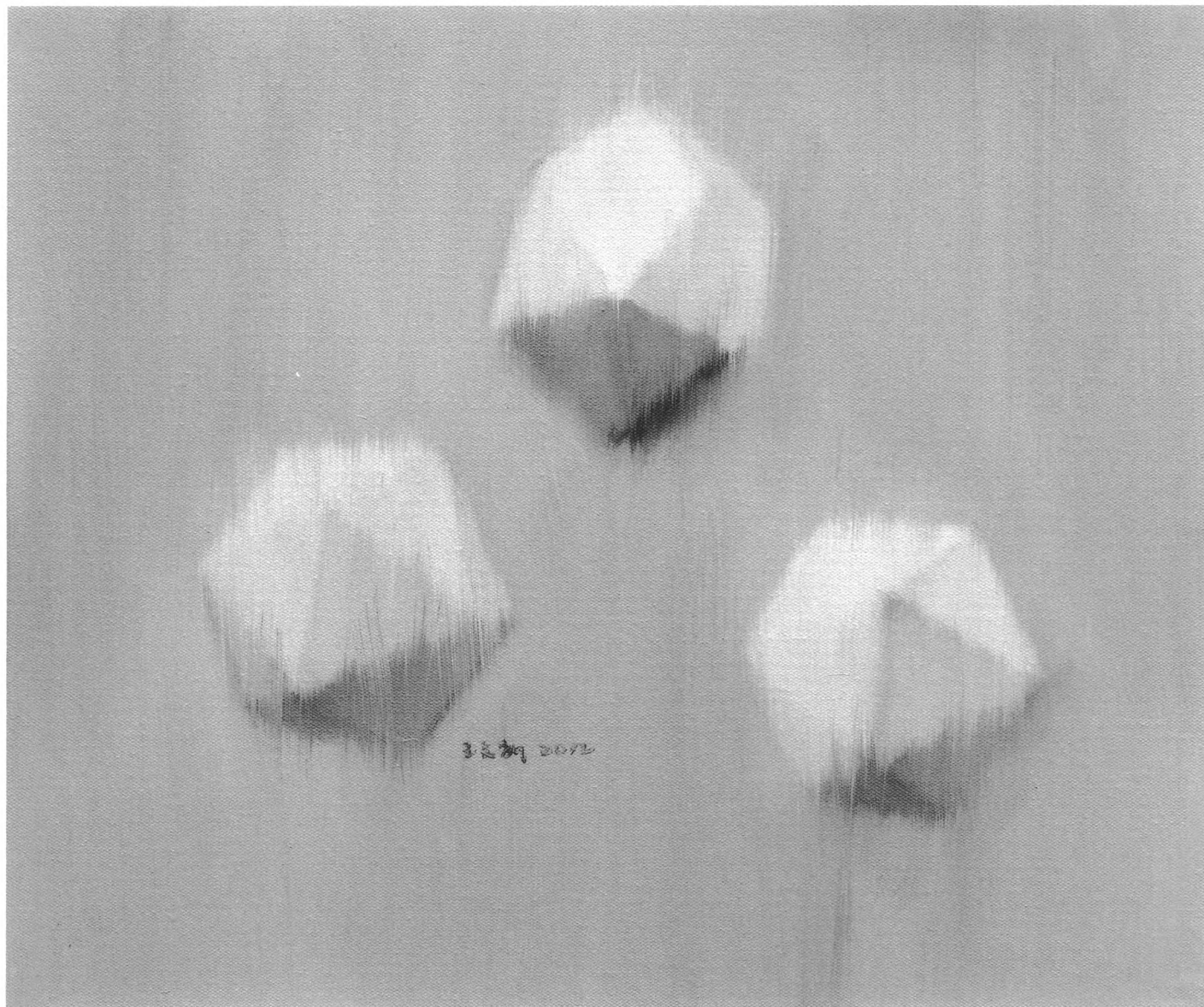
王文新·几何体之二(油画 50x60cm 2012)