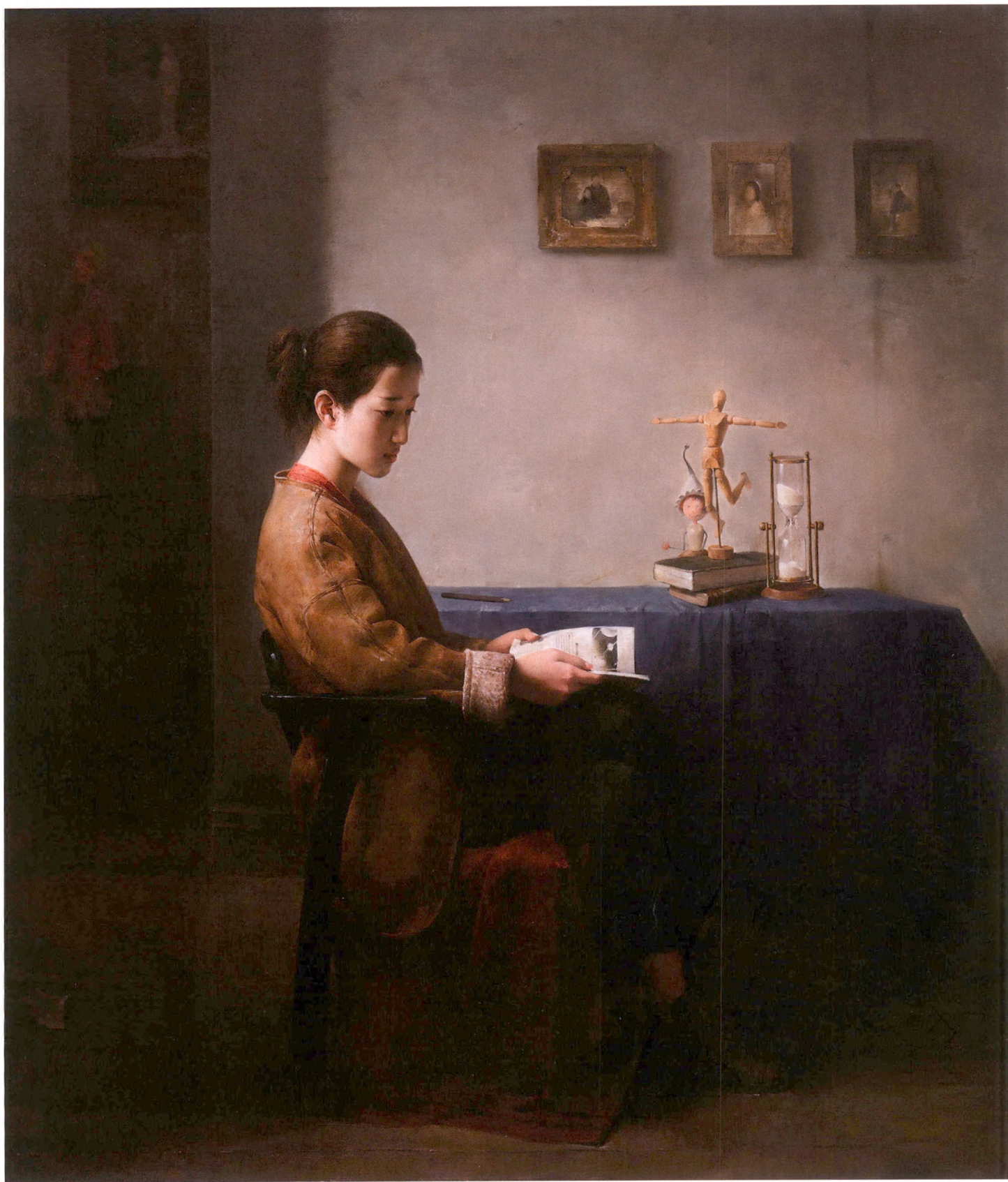
时光荏苒 120x110cm 2016