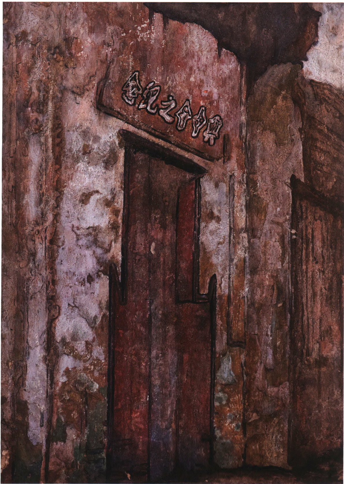
辛亥遗址 65x55cm 2011