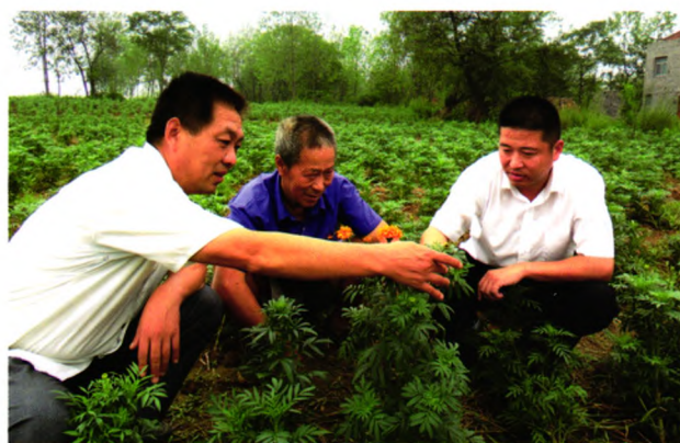
深入田间地头了解农民资金需求