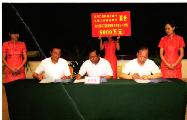
与兄弟社合作为河谷组群建设重点项目授信