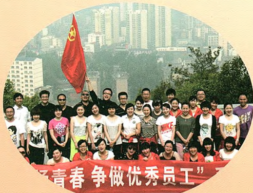
我行开展五四“激扬青春，争做优秀员工”系列活动