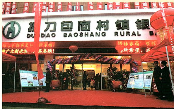
掇刀包商村镇银行月亮湖支行盛大开业

掇刀包商村镇银行自成立以来，坚持走差异化发展道路，致力于服务“三农”和小微企业，不断创新经营模式，服务县域经济发展，努力打造荆门人自己的银行。