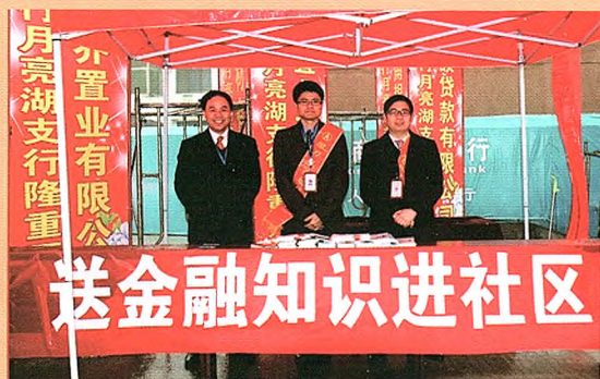
我行开展送金融知识进社区宣传活动