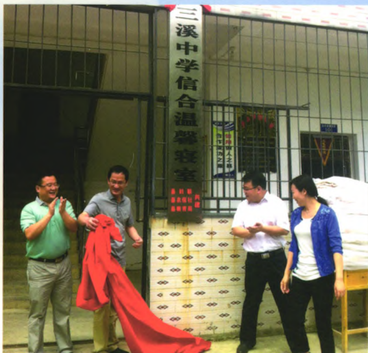
三溪中学“信合温馨寝室”揭牌