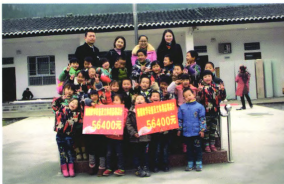
恩施村镇银行为恩施市龙凤坝青堡小学献爱心