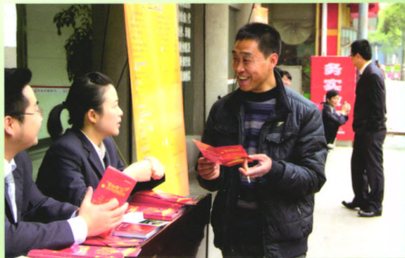
恩施村镇银行组织开展金融知识宣传活动

在2015年10月23日于北京举办的第八届中国村镇银行发展论坛上，恩施村镇银行荣获全国百强村镇银行、全国村镇银行资产总额前50强、服务三农与小微企业优秀单位3项殊荣。