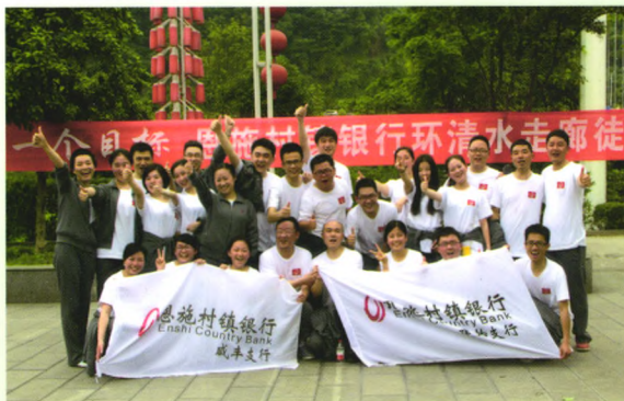
恩施村镇银行举行环清水走廊徒步活动

恩施村镇银行成立于2010年12月22日，是全国首批、湖北省第一家地市级总分制村镇银行，也是恩施州唯一一家州级独立法人股份制商业银行。