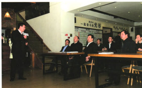
中国人民银行陈雨露副行长一行实地考察创业咖啡