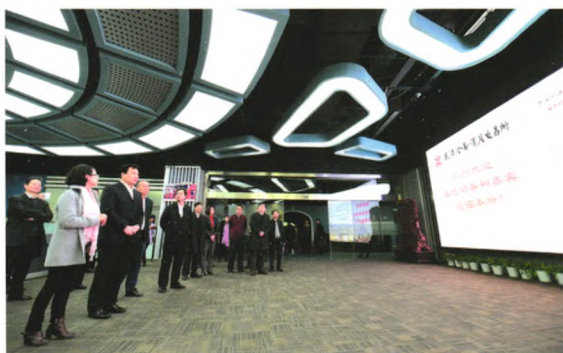
中国人民银行陈雨露副行长考察武汉金融资产交易所