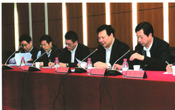
中国人民银行陈雨露副行长（右二）听取科技金融发展情况的汇报