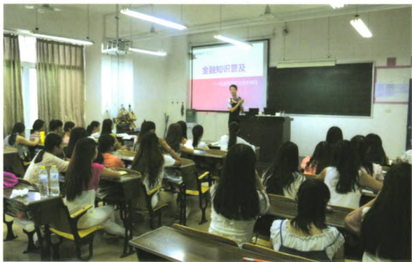
开展“金融知识普及月”活动