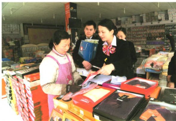
进社区、进园区、进市场“三进”活动