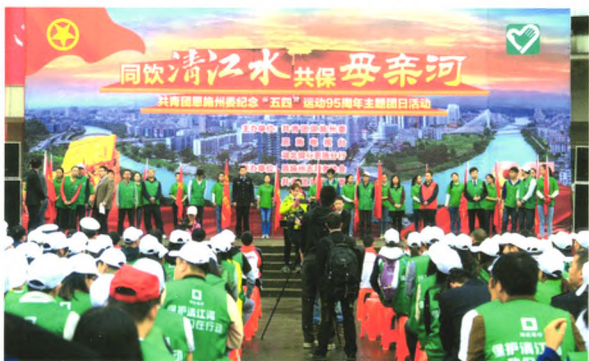
与共青团恩施州委、恩施电视台联合开展“同饮清江水·共保母亲河”环保公益活动

自2012年12月24日开业以来，湖北银行恩施分行在发展中不断壮大，在改革中成就事业，在转型中实现升级，在服务中体现价值，取得了骄人的经营业绩，打造了高素质的员工队伍，树立了良好的社会形象，获得了高度的政府监管认同。分行先后荣获省国资委先进基层党组织、省国资委信访维稳先进单位、恩施州文明诚信示范单位等荣誉称号，综合绩效考评一直处于湖北银行第一方阵，分行班子被总行党委表彰为优秀班子。