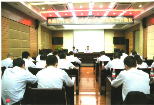
分行党委安排部署党风廉政建设和纪检监察工作