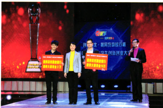
独家冠名大别山大学生创新创业大赛