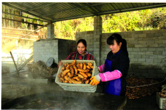
小额贷款带动山区农户种植药材致富