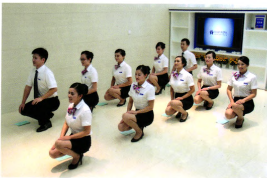
文明规范服务培训