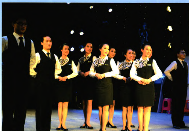
职业化的员工形象