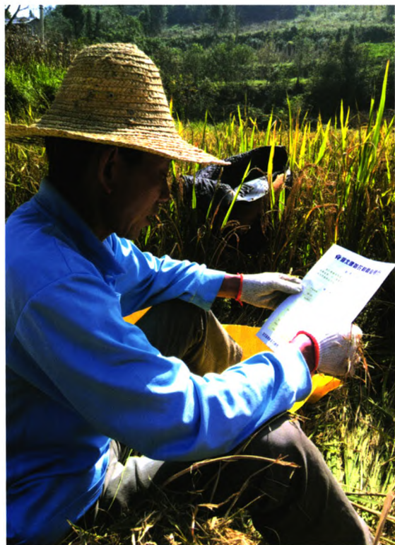
田间地头宣传政策

湖北建始农村商业银行的前身是建始县农村信用合作社，成立于上世纪50年代，是建始县历史最为悠久的金融机构。我行现有员工256人(含退休人员)，下辖2个直属营业部，11个支行，2个分理处，共15个营业网点。是全县从业人员最多、营业网点覆盖最广、业务规模最大、综合实力最强的地方性金融机构。近几年来，建始农村商业银行以市场为导向，以客户为中心，立足社区，面向“三农”、面向中小企业、面向县域经济，大力提升服务水平，创一流业绩和服务，多次被省联社授予先进单位荣誉称号，被县政府表彰为纳税大户。截至2016年6月，全县农商行存款总额32亿元，贷款总额22亿元，存贷款总额在全县金融机构中均居首位。