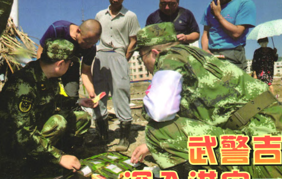
为灾区群众发放药品