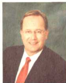
安广升 斑马技术公司首席执行官