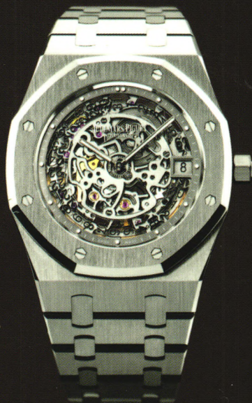
ROYAL OAK SKELETON 皇家橡树镂空系列腕表 铂金材质。40周年限量版。

这款尊贵的限量版腕表搭载一枚出神入化的镂空电镀机芯，并完全以人手进行精工装饰，安置在一体成形的铂金表壳中。标志性的八角形表圈以八颗经抛光的白金螺丝固定，再次呈现专属皇家橡树的独一无二的优雅运动风格。