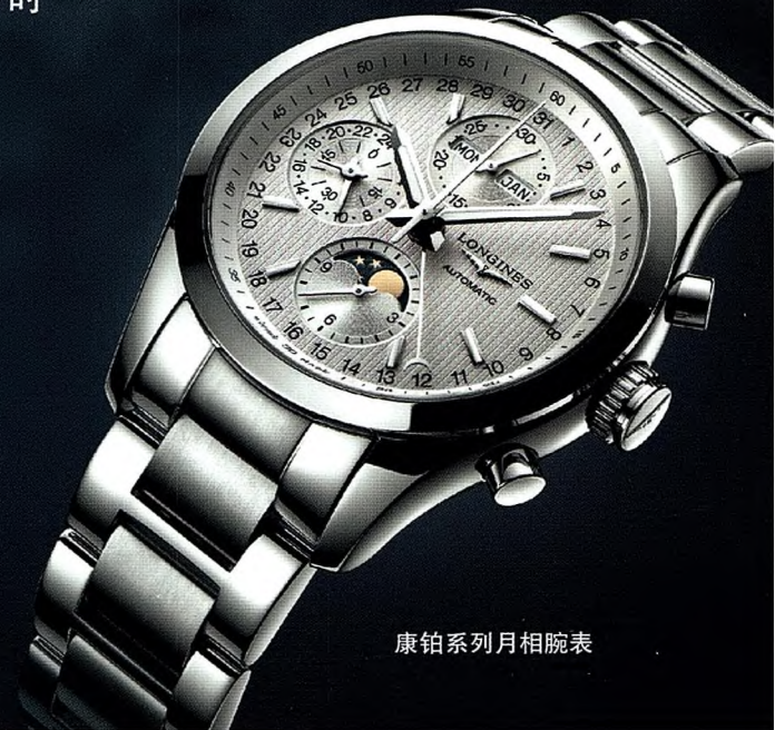
康铂系列月相腕表