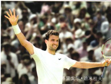
格里戈尔·迪米杜夫