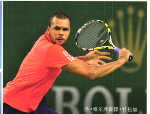
乔·维尔弗雷德·特松加