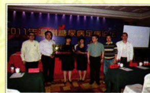
成立糖尿病足病治疗中心