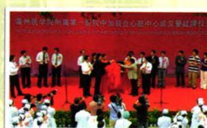
中加心脏中心成立