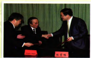
与日本国小仓纪念医院结成协作医院