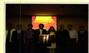
成立中美乳腺癌多学科协作诊疗中心