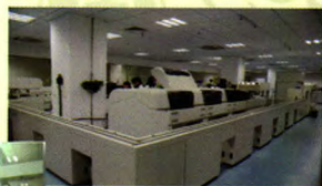
先进的全实验室智能整合型自动化流水线