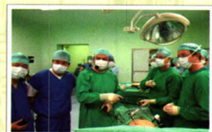
中美微创技术培训教育研究所