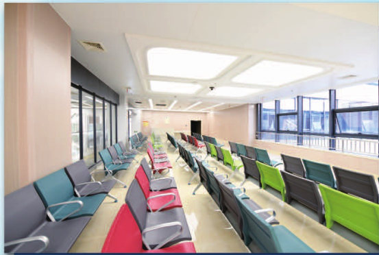
东城院区门诊候诊区