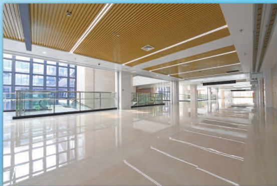
东城院区门诊医疗街