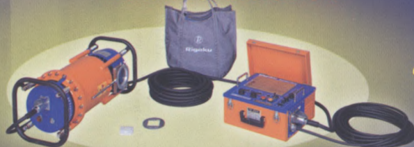
200SPS 200EGM2 RF-300M2F 250EGM2 300EGM2