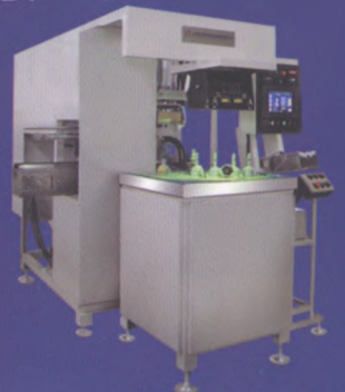
ZY-CEW-2000S 外星轮专用磁粉探伤机