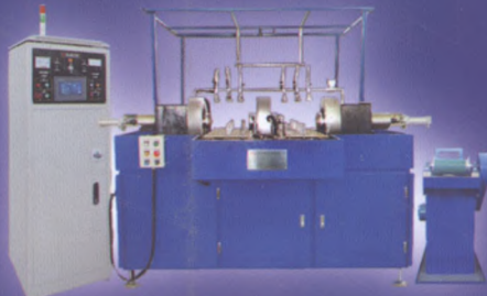
ZY-CEW-2000L 连杆专用磁粉探伤机组(自动上下料、双磁化工位)