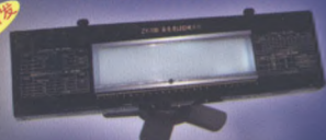
高亮度、长寿命、低功耗 ZY-100 LED观片灯