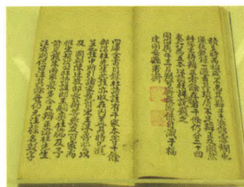
清·施鸿保《杜诗说》（稿本）