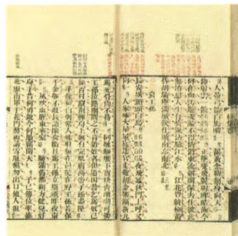
清光绪二年刊卢坤五家（五色） 评本《杜工部集》