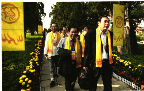
世界儒学大会大会代表参加公祭孔子大典