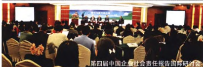
第四届中国企业社会责任报告国际研讨会