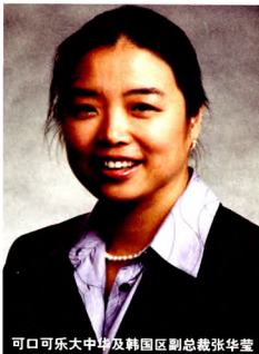
可口可乐大中华及韩国区副总裁张华莹