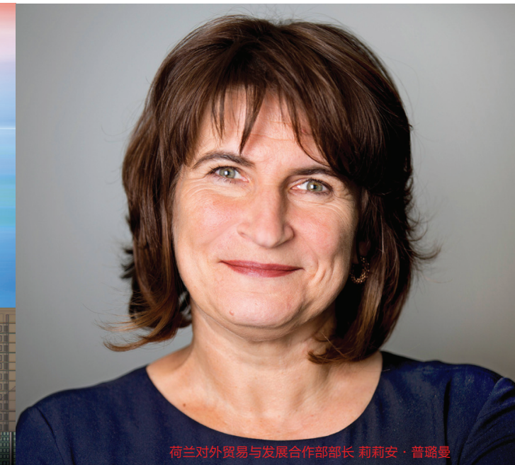
荷兰对外贸易与发展合作部部长 莉莉安·普璐曼