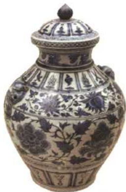
青花兽耳罐花卉盖罐（元）

52 同步辐射成像技术在科技考古、艺术史、文物保护 以及古生物学中的应用 / 张兴香