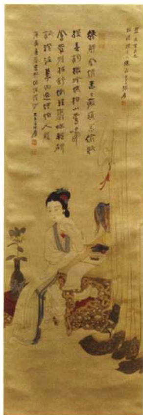
张夫千作品 仕女图