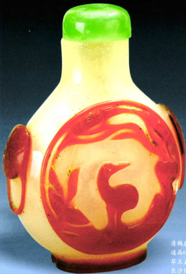
清鹤鹿纹套红料鼻烟壶 通高6.4厘米 腹宽5.3厘米 翠玉盖 长沙博物馆藏

IDENTIFICATION AND APPRECIATION TO CULTURAL RELICS