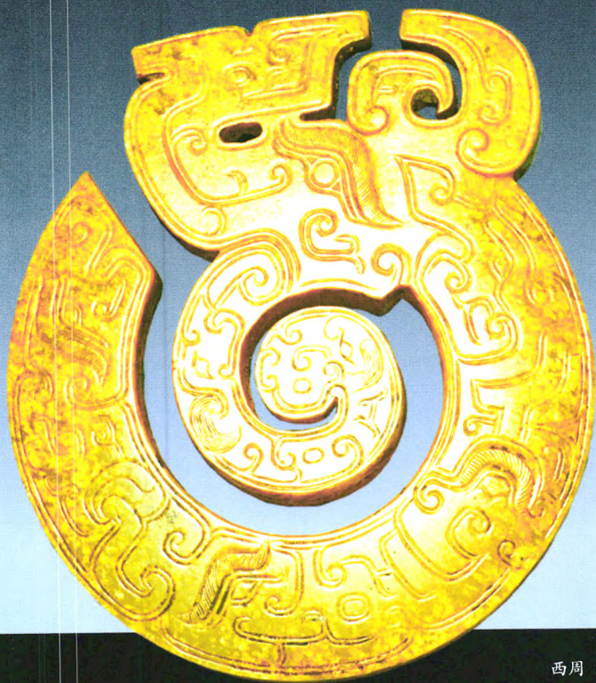
玉螭龙 西周（公元前11世纪—前771年） 长5厘米 宽4.3厘米 山西博物院藏