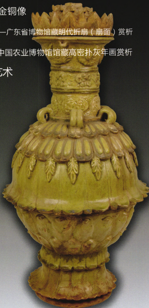
南朝青瓷莲花尊 南京市博物馆藏