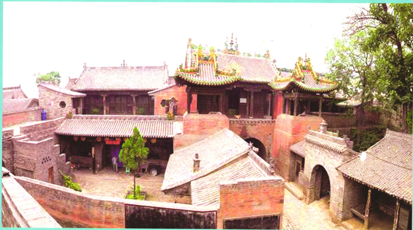
山西介休张壁古堡