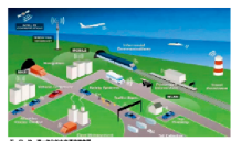
图 10-1 卫 星 通 信 网 络 结 构 图