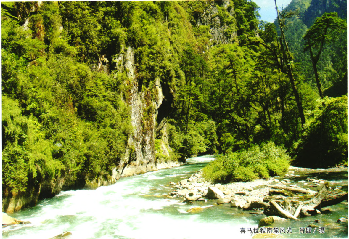
喜马拉雅南麓风光