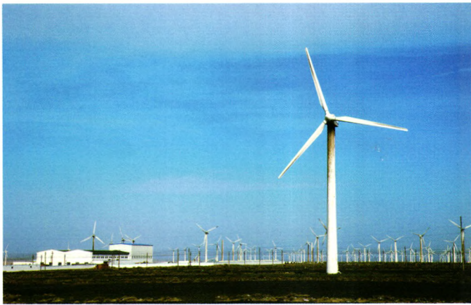
达坂城风力发电厂

风沙剥蚀了满身繁华 铮铮铁骨更显挺拔 一个信念 支撑着绝不倒下 要做友谊之路上的灯塔