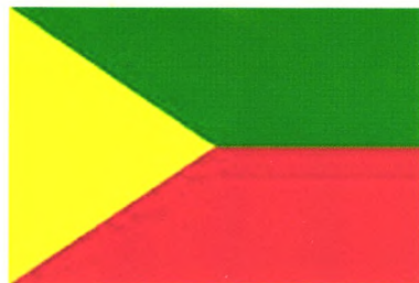
外贝加尔边疆区旗

赤塔州州旗、州徽是赤塔州杜马1995年11月23日和12月21日两次批准的。单头鹰是西伯利亚最古老的官方标志。1692年它出现在西伯利亚一些达斡尔城堡的印章上。沙皇的鹰向着东方太阳升起的地方飞去，那里自古以来是俄国开拓者朝思暮想的地方。他们探索、开发和保卫着那片未知的土地。朝下的弯弓表示热爱和平，只准备保卫而不会发起进攻。它还表明那里有很多森林，可以发展狩猎业。旗帜与徽标的色调是统一的。红色和绿色象征着赤塔州位于边界地区，黄色是外贝加尔哥萨克的颜色，他们自古以来保卫着俄罗斯的东部边境。黄色象征着无尽的草原，绿色象征着原始森林和丰富的动物资源，红色象征着矿藏。