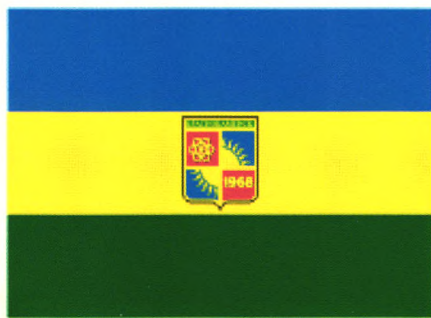
克拉斯诺卡缅斯克市市旗