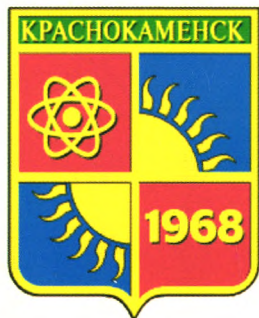
克拉斯诺卡缅斯克市市徽