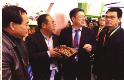
国家林业局彭有冬副局长在省林业厅领导陪同下听取盛大公司汇报