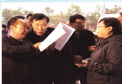
魏增军副省长视察盛大公司红仁核桃基地