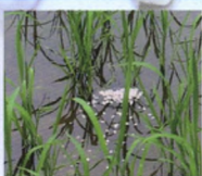
漂浮颗粒运动扩散