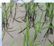
大颗粒扩散成药膜