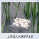
水溶袋入水漂浮于水田