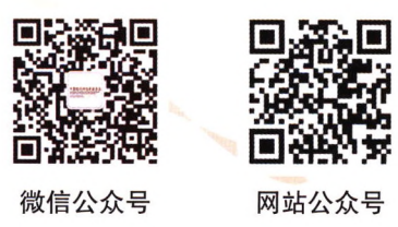
微信公众号 网站公众号