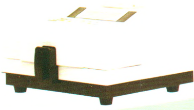
14 C液体闪烁计数仪 注册号: 皖食药监械(准)字2013第2400067号