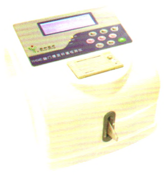
幽门螺旋杆菌检测仪 注册号: 皖械注准20152400145