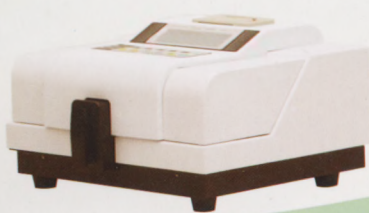
14 C液体闪烁计数仪 注册号: 皖食药监械(准)字2013第2400067号