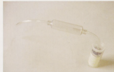
闪烁采样瓶 注册号: 皖械注准20152400058