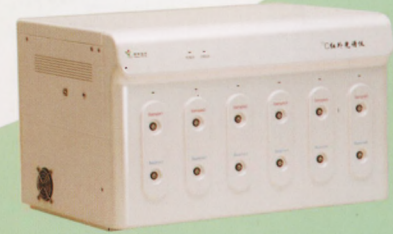
13 C红外光谱仪 注册号: 皖食药监械(准)字2014第2400117号