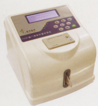
幽门螺旋杆菌检测仪 注册号: 皖械注准20152400145