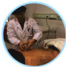
中医护理特色技术